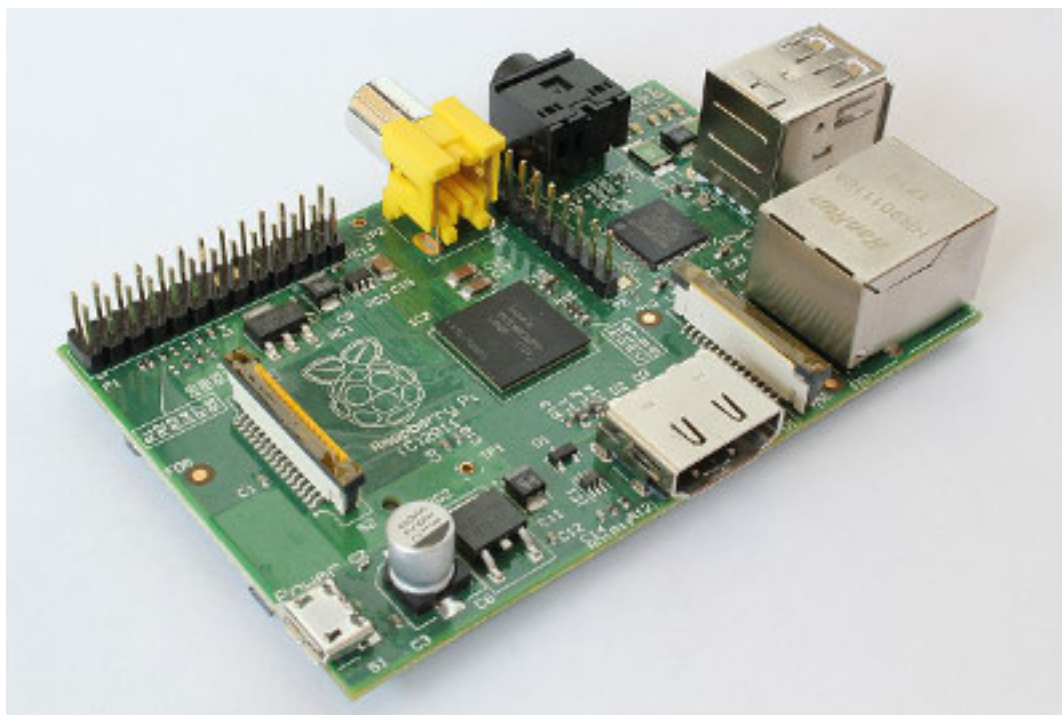
Raspberry Pi Model B

Po realnim performansama Raspberry Pi se može mjeriti s Pentiumom II na 300MHz, dok je grafička kartica ekvivalentna onoj u Xboxu iz 2001. godine. Malene dimenzije i malena potrošnja struje, uz relativno slabi procesor donose veliku prednost, nije potrebno nikakvo dodatno hlađenje uređaja. Po podržanim operativnim sustavima mogli ste zaključiti da je Raspberry Pi pravo malo računalo. Instalacijom Debiana moguće je dobiti potpuno funkcionalan poslužitelj solidnih performansi. Međutim, pločica nema nikakvih sigurnosnih zaštita, pa ako se, primjerice, kratko spoje neki pinovi, trajno ćemo uništiti neke elemente. Također, Raspberry Pi dolazi samo u jednoj veličini. Naravno, Pi nije namjenjen za ozbiljnije stvari, ali kao kućni poslužitelj radit će odlično.